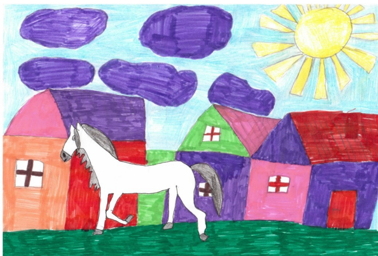
Рисунок по рассказу И. Я. Яковлева «Как лошадь искали».

Моя семья - самая хорошая. Она состоит из четырёх человек. Это папа, мама, сестра и я. Мы