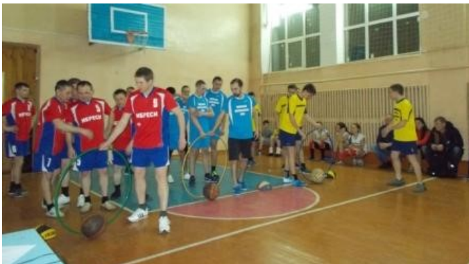
На фото: турнир «Отцы и дети»