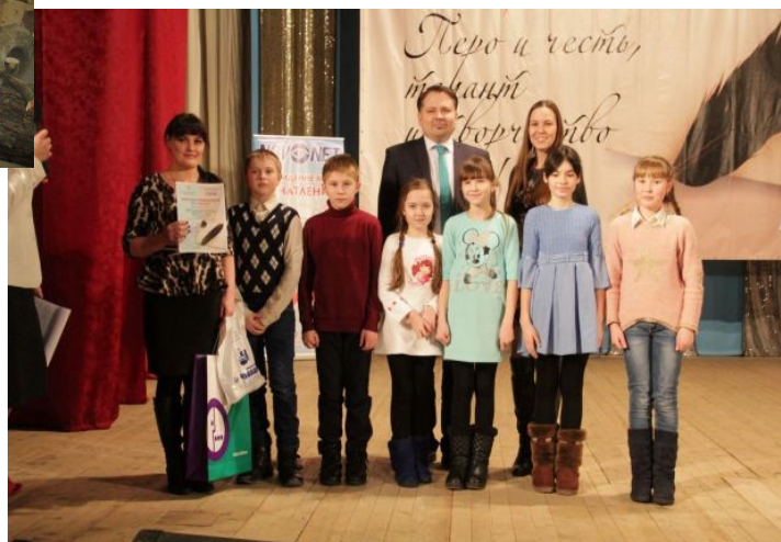
На фото: «Школьное конфетти» на церемонии награждения

Нас радушно приняли. Мы побывали на выставках разных поделок, изготовленных руками детей. Посетили исторический музей, где представлены артефакты времён Великой Отече-