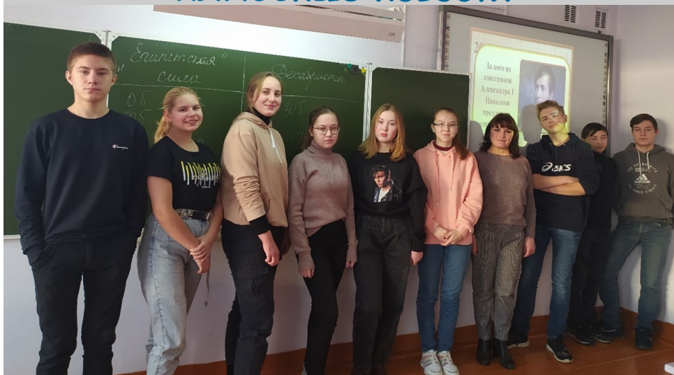
Интерактивная игра «Время. События. Люди» в 9 классе.