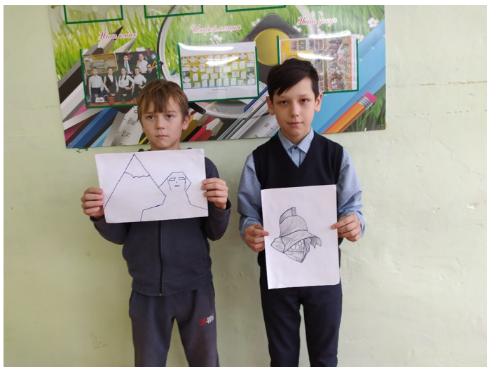
Конкурс «Мы рисуем историю». Ученики 5 класса.