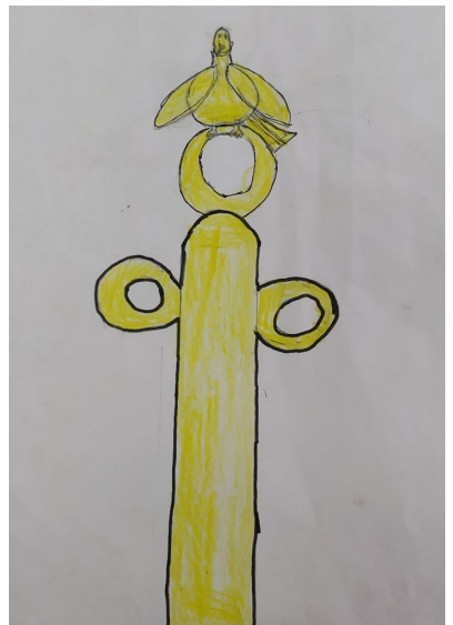
«Голубь на куполе Софийского собора». Рисунок Екатерины Филипповой, 6 класс.

История-это не только предмет в школе, которым многим кажется сложным, это жизнь нашего мира: прошлое, настоящее. Знать историю нужно для того, чтобы знать всё о прошлом своей родины. Ведь без прошлого не бывает будущего. Знание истории помогает расширить кругозор, мыслить шире, не совершать ошибок, которые были допущены нашими предками.