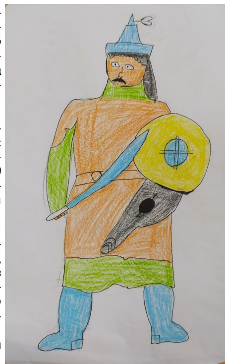
«Ордынский воин». Рисунок К. Чураева, 6 класс.

Российская империя просуществовала с 1721 по 1917 годы, почти 200 лет. Это огромный временной промежуток, начинающийся правлением Великого Петра, который ввез всеми известную и любимую картошку и заканчивающийся кризисом и Гражданской войной. Произошло огромное количество реформ, войн,